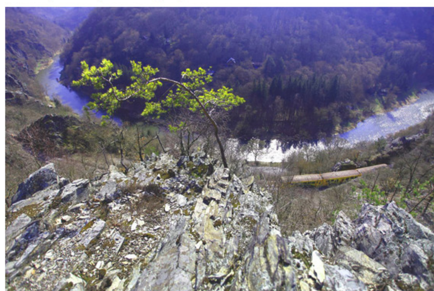
Vyhlička Třeštibok nad Sázavou